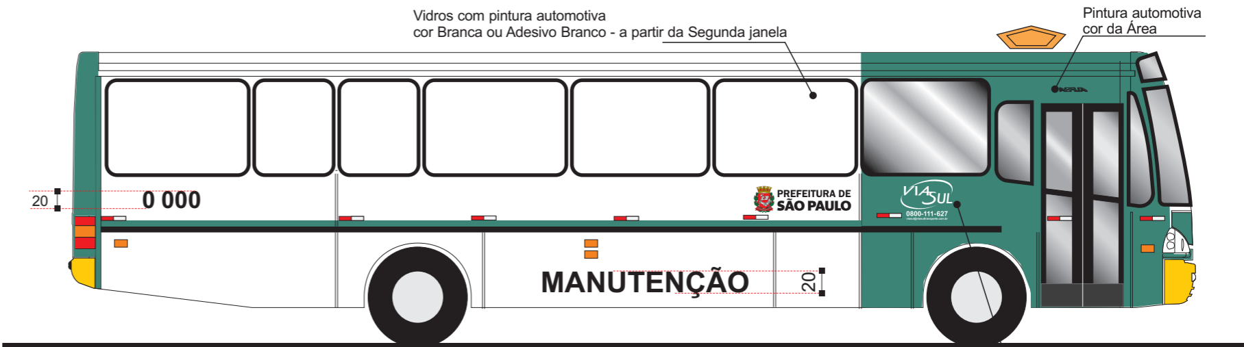
Vista lateral direita

Identificação do Consórcio e telefone 0800