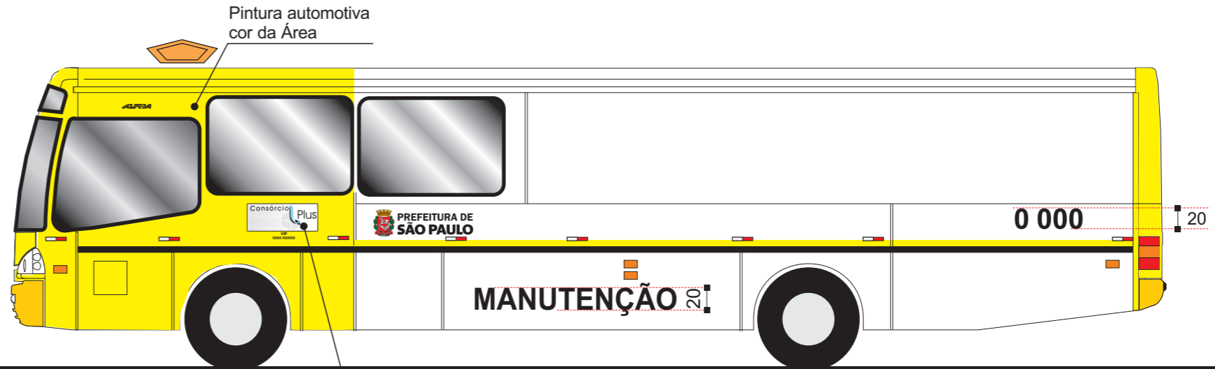
Vista lateral esquerda

Identificação do Consórcio e telefone 0800