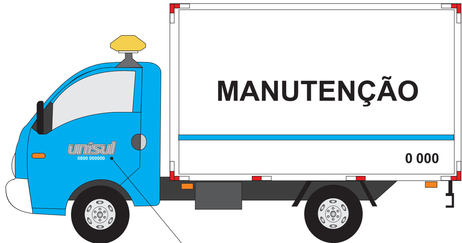
Identificação do Consórcio e telefone 0800