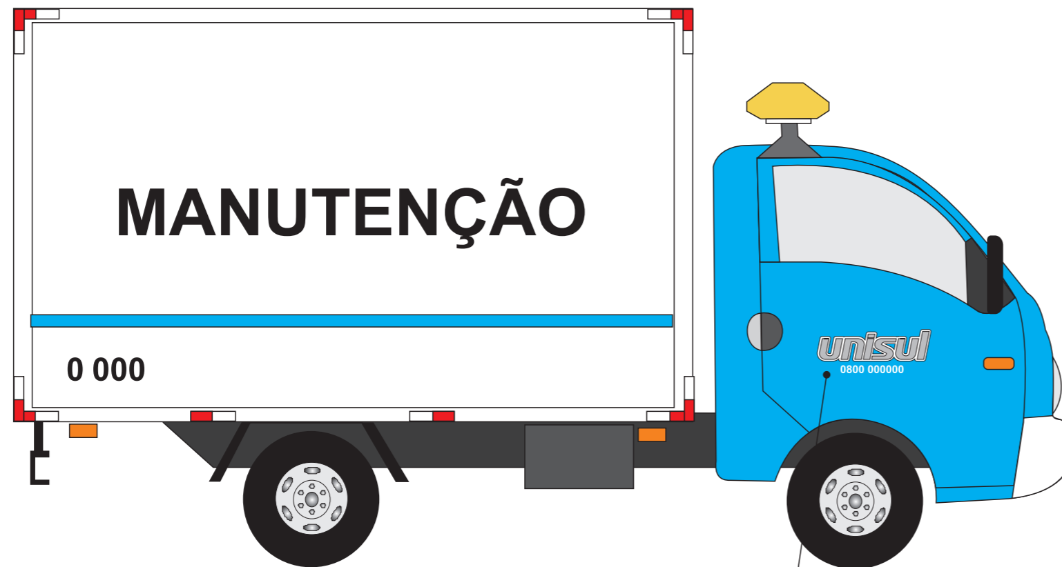
Identificação do Consórcio e telefone 0800