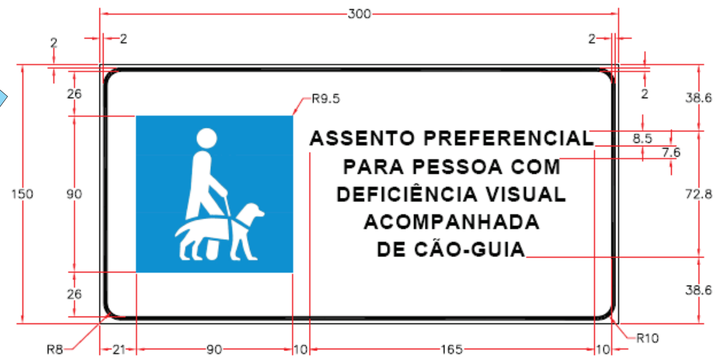
POLTRONA RESERVADA PARA DEFICIENTE VISUAL COM CAO GUIA

identificação do banco simples ao lado da área reservada.