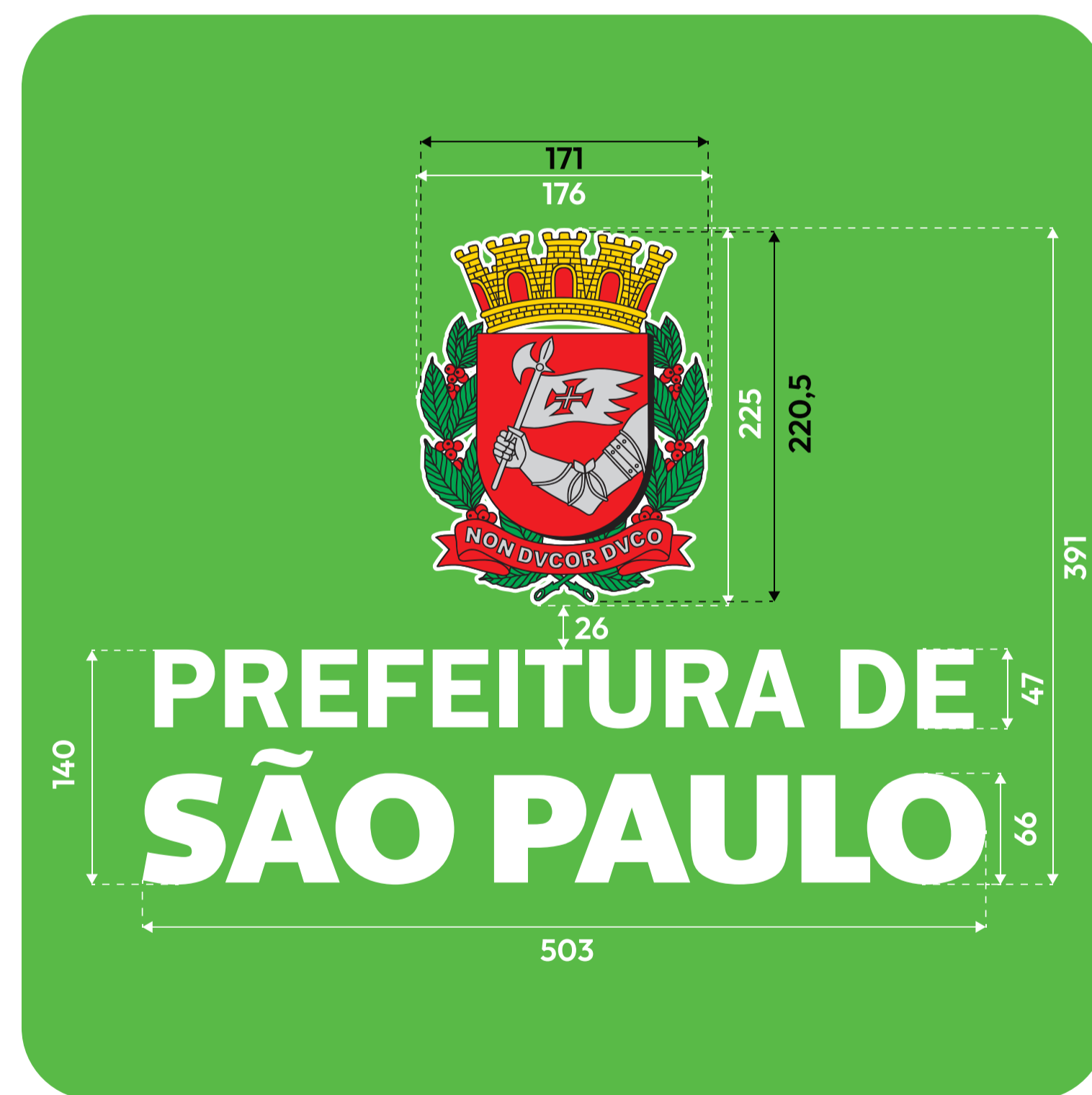
DETALHE CONJUNTO TRASEIRO

DETALHE DO FUNDO VERDE, APENAS ILUSTRATIVO, O ADESIVO, CONTINUA COM O FUNDO TRANSPARENTE